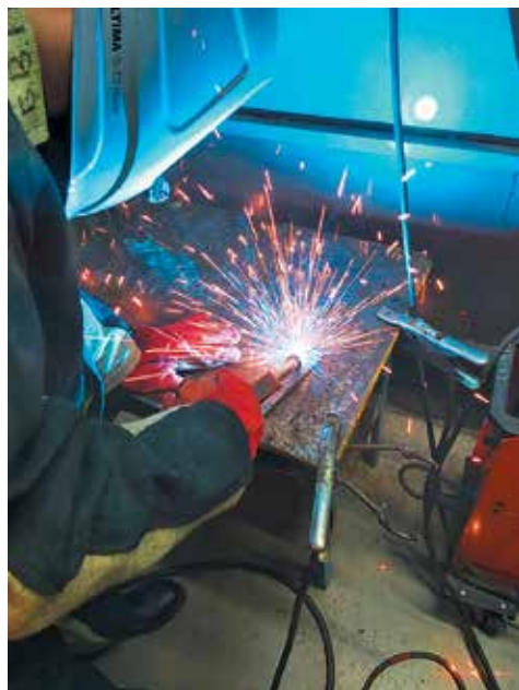
На фотографии обучающиеся группы 30-61 специальности Судостроение в слесарно-сборочной мастерской

ную машинку для вольфрамовых электродов, тележку гидравлическую TOR DF-III 2500 гр.