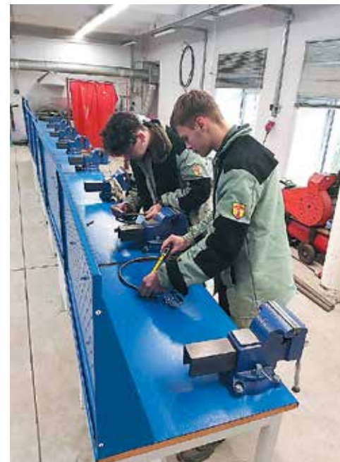
На фотографии обучающиеся группы 30-61 во время учебной практики

Выполненные изделия в том числе служат колледжу для обновления интерьеров помещений. Так, например, для корпуса 5 на Курляндской 39 были изготовлены дизайнерские подставки для цветов.