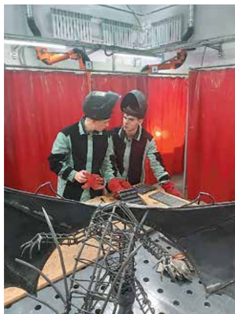
На фотографии обучающиеся группы 30-61 во время учебной практики